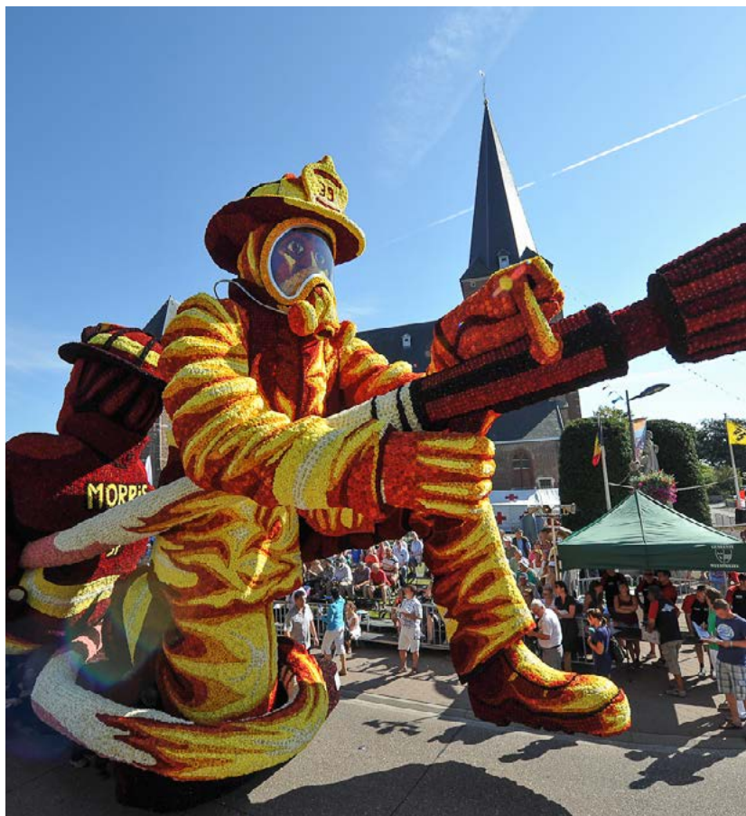
Het Loenhoutse Bloemencorso