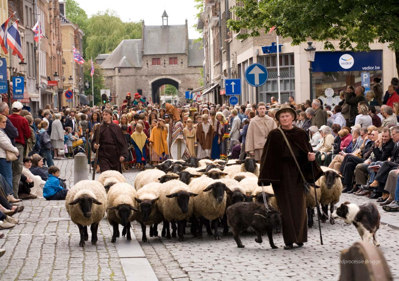
Heilig Bloedprocessie Brugge