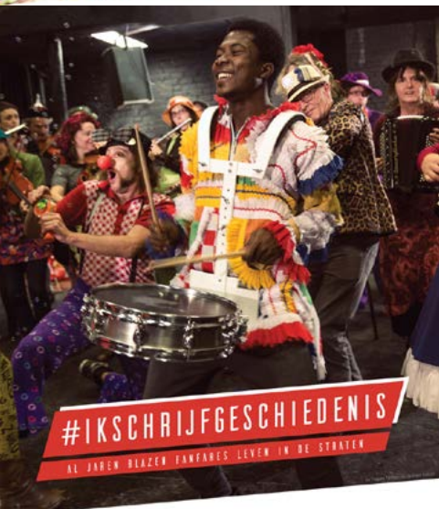
Campagnebeelden van #ikschrijfgeschiedenis

Als lokaal bestuur kun je natuurlijk ook gebruikmaken van bestaande sensibiliseringsinitiatieven. Specifiek voor immaterieel erfgoed is er de campagne #ikschrijfgeschiedenis , met de bijhorende website www.ikschrijfgeschiedenis.be . Deze website verzamelt foto's en filmpjes van mensen die actief bijdragen aan het levend houden van tradities en technieken. Op de website kunnen traditiedragers ook sjablonen downloaden om affiches te maken op maat van hun eigen immaterieel erfgoed. De weg wijzen naar dergelijk instrument en mee affiches drukken en verspreiden kan een gezamenlijke sensibiliseringsactie zijn die immaterieel erfgoed in de streek op een positieve manier in de kijker plaatst.