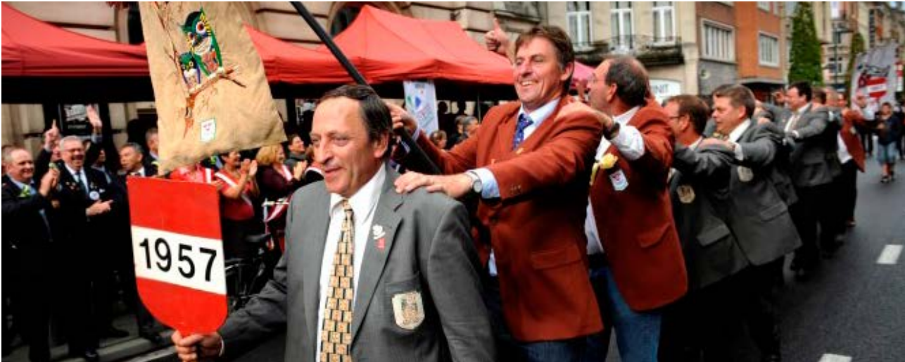
Het Leuvense Jaartallenleven