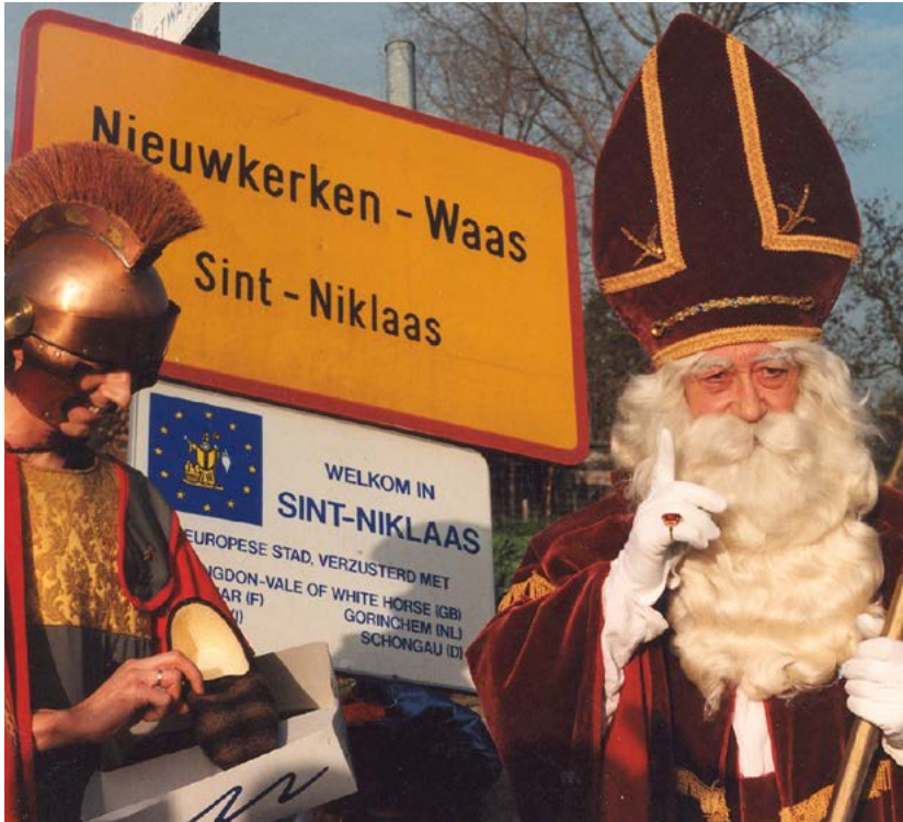
Sinterklaas in Sint-Niklaas