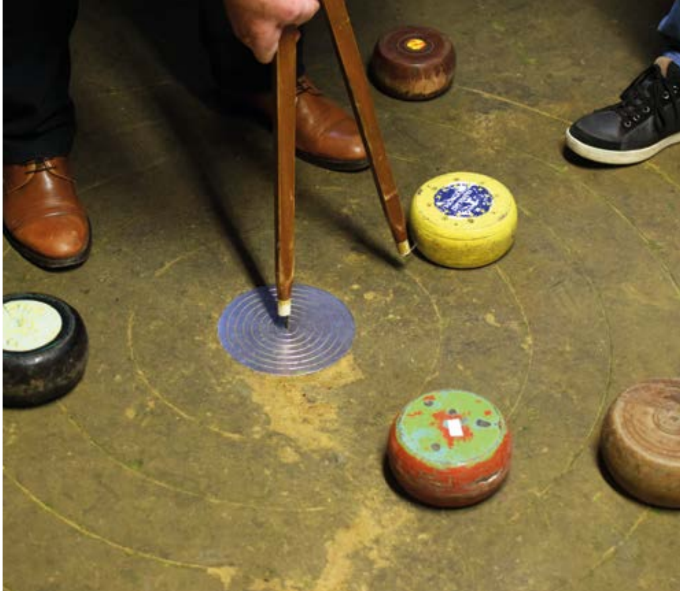
Platbollen © Philippe Debroe